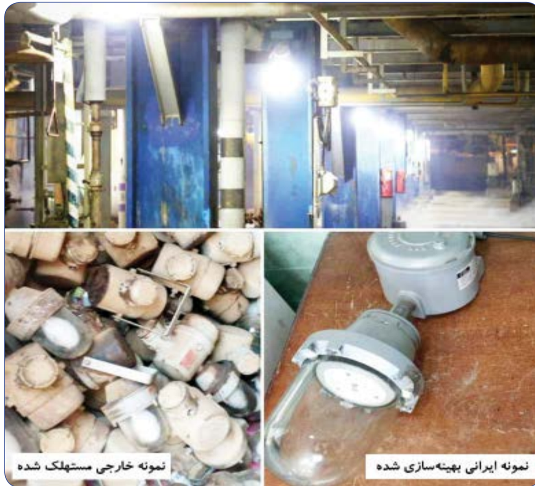
نمونه خارجی مستهلک شده